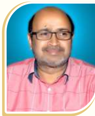
डा. एम. जगन मोहन, आईएएस कृषि आयुक्त, तेलंगाना सरकार