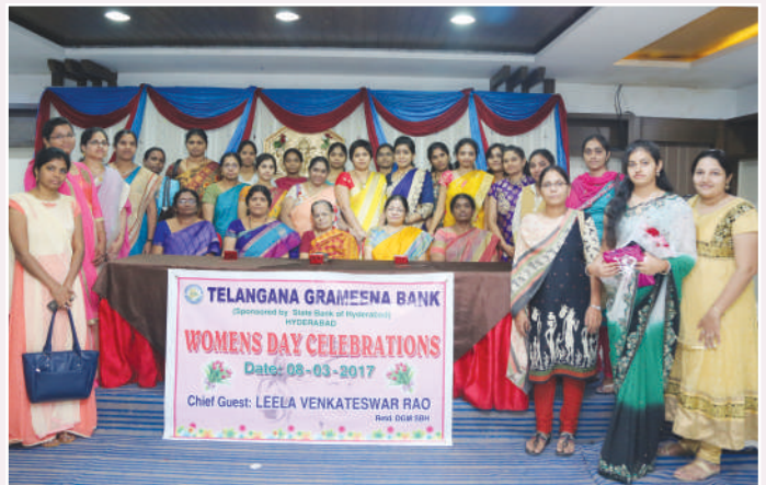
Women's Day Celebrations on 8-3-2017 by Women Staff of Telangana Grameena Bank.